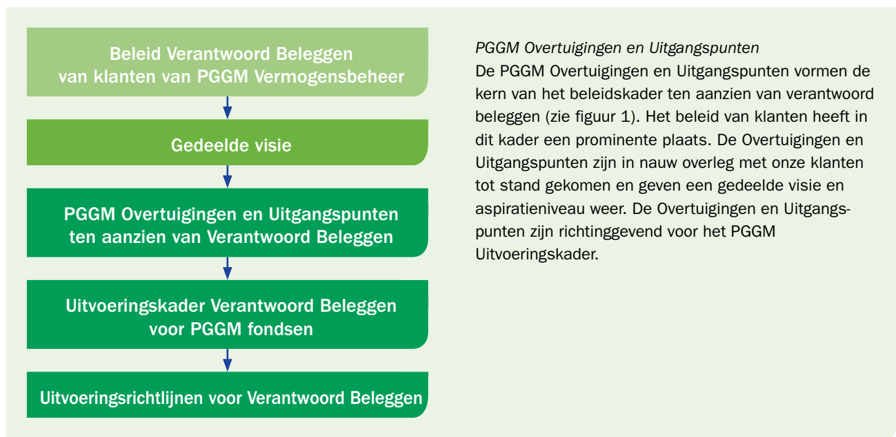
Figuur 1 Beleidskader Verantwoord Beleggen